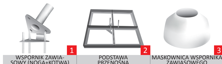
1 WSPORNIK ZAWIASOWY (NOGA+KOTWA)