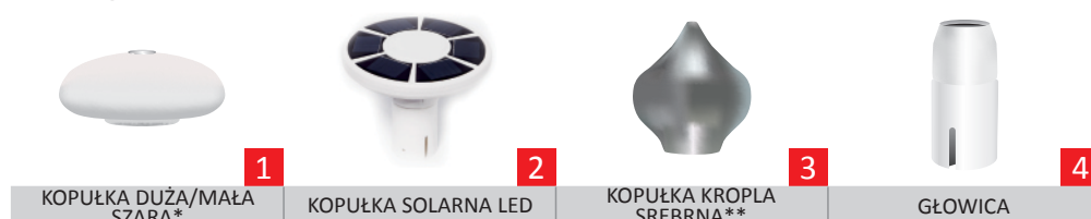
1 KOPUŁKA DUŻA/MAŁA SZARA*